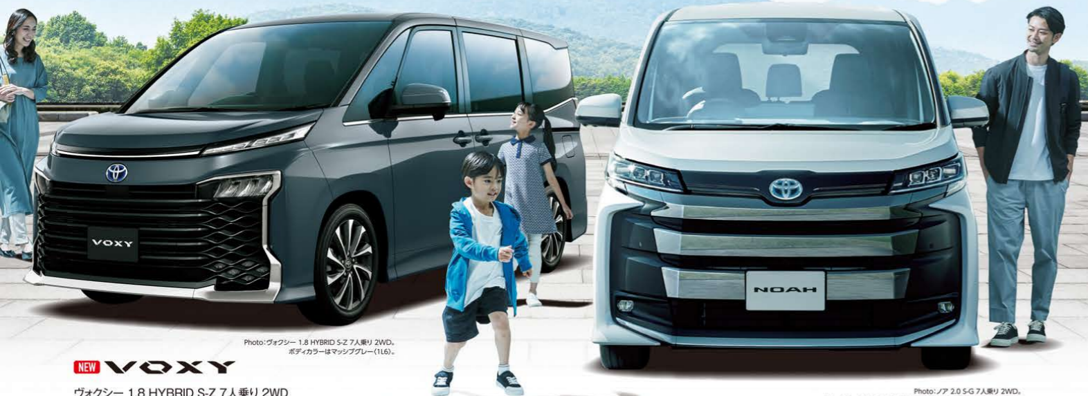
Photo:ヴォクシー 1.8 HYBRID S-Z 7人乗り 2WD、ボディカラーはマッシュグレー(116)。 NEW VOXY ヴォクシー 1.8 HYBRID S-Z 7人乗り 2WD ■電気式無段変速機 ■6AA-ZWR90W-BPXRB ヴォクシー車両本体価格等 3,090,000円[ 2.0 S-G 2WD ] ~ 3,960,000円[ 1.8 HYBRID S-Z E-Four ] 車両本体価格 3,740,000円 Photo:ノア 2.0 S-G 7人乗り 2WD、ボディカラーのホワイトパールクリスタルシャイン(070) 133,000円はメーカーオプションで車両本体価格には含まれておりません。 NEW NOAH ノア 2.0 S-G 7人乗り 2WD ■Direct Shift-CVT ■6BA-MZRA90W-APXSH ノア車両本体価格等 2,670,000円[ 2.0 X 2WD ] ~ 3,890,000円[ 1.8 HYBRID S-Z E-Four ] 車両本体価格 3,040,000円