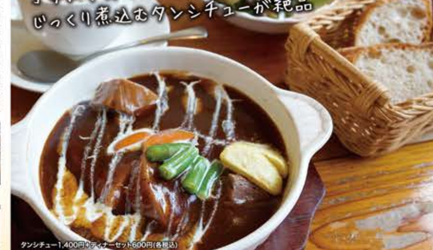
住所/岩出市湯屋8-2 営業時間/11:00~14:00/17:00~21:00 定休日/水曜 駐車場/15台(共用) ☎ 0736-63-2708