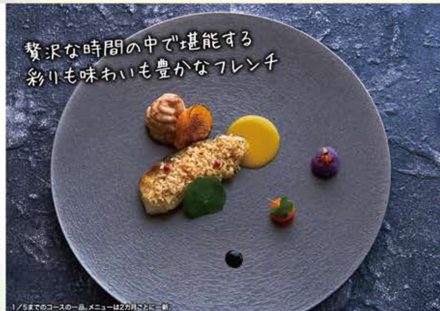
住所/西牟婁郡白浜町2998-10 レストラン営業時間/17:30~21:30(前日までに要予約) 定休日/不定休 駐車場/19台 ☎ 0739-42-4555

館内に一步入った瞬間から、非日常の別世界感が広がる1日10組限定のオーベルジュ。宿泊施設を備えたレストランですが、フレンチのディナーコース(9,900円/税別)は、予約すれば白帯でも利用できます。塩分やバターを控えめに、紀南産を中心とする厳選素材の持ち味を存分に生かして削り上げられる料理は、一品一品がアートのような美しさ。香りや温度も含め、最もおいしいタイミングで贅沢な味わいを堪能できます。ディナーで来館の方は、天然温泉(大人500円、小学生350円)の利用も可能。