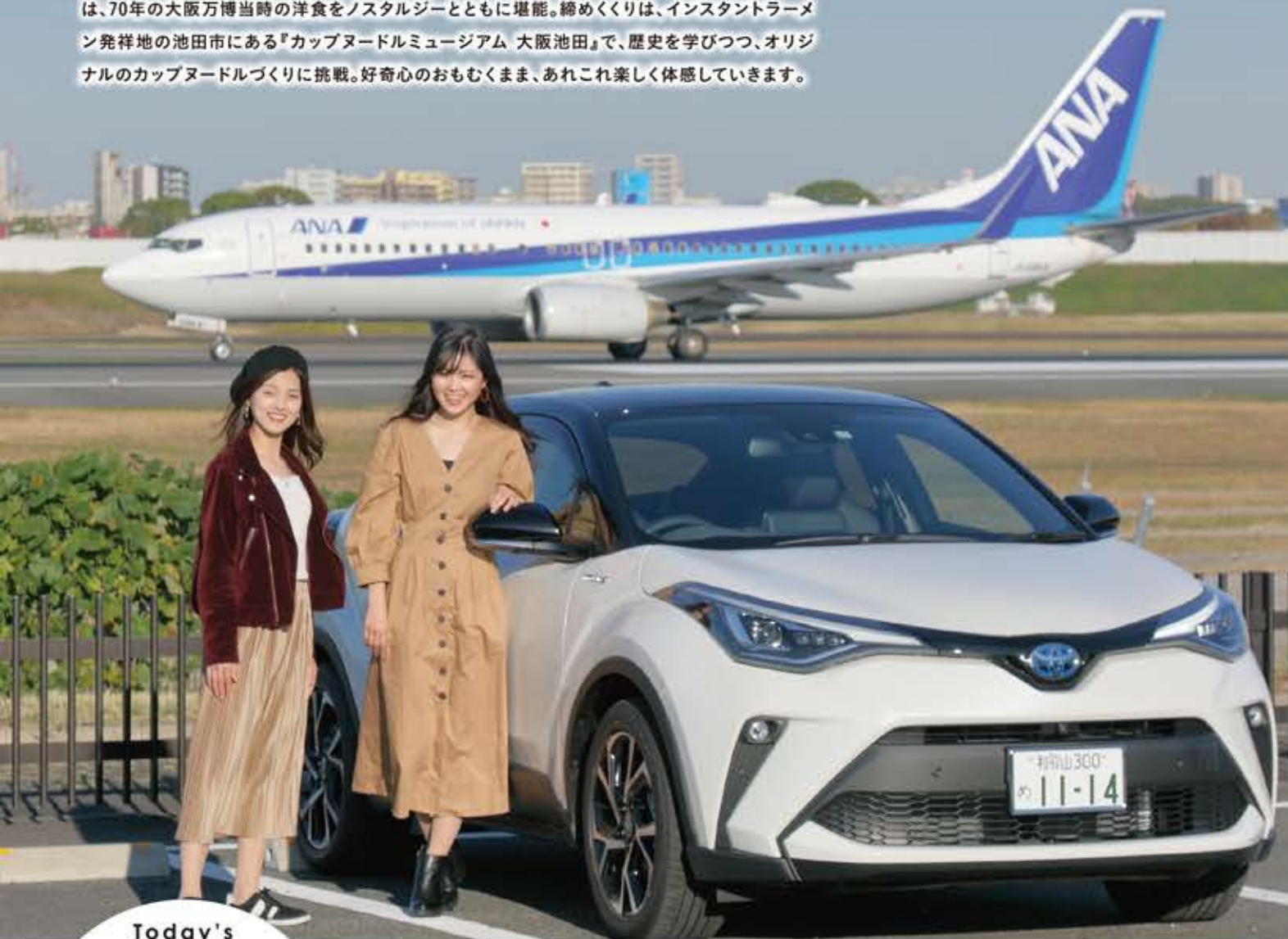
Today's Drive car C-HR

大阪の代表的な高級住宅エリア・北摂に映える洗練されたデザインの【C-HR】。走りの楽しさ、燃費性能にも優れています。"Toyota Safety Sense"は全車標準装備で、安全性能も充実。慣れない街なかのドライブをしっかりサポートしてくれます。スマホのアプリを使用できるディスプレイオーディオも全車に標準装備。