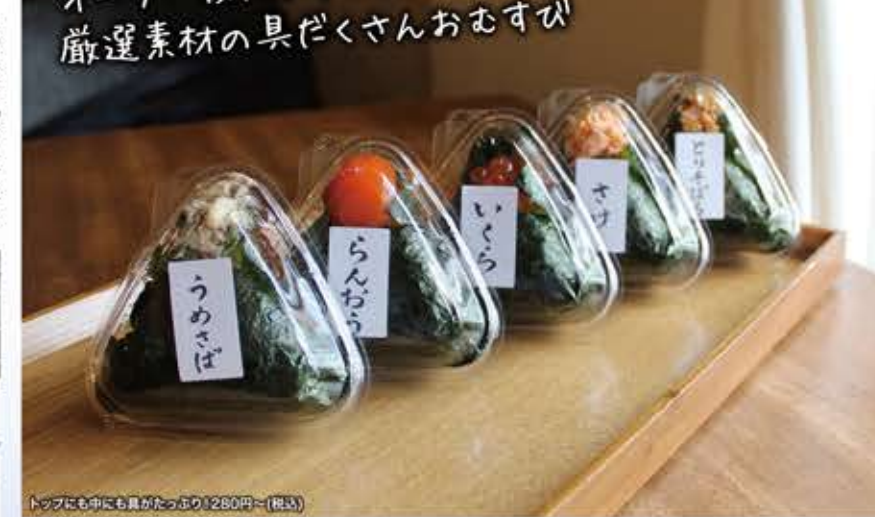
住所/和歌山市番町28 ハウスブルーネ 101 営業時間/11:00~20:00(19:30LO) 土日祝は10:00~17:00 定休日/日曜不定休 駐車場/なし(近隣にコインパーキングあり) ☎ 090-6607-3108