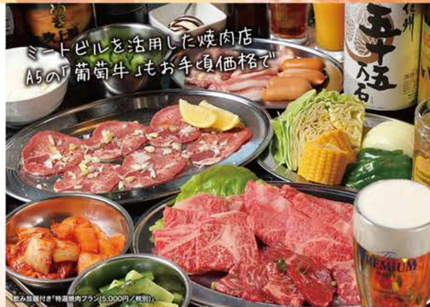
飲み放題付き「特選焼肉プラン(5,000円/税別)」 住所/和歌山市中町33 ミートビル1F 営業時間/17:00~22:30(21:45LO) ※祝日除く火~金曜はランチあり(11:30~14:00)(ランチのみ税込) 定休日/日曜 ※11月・12月は無休 駐車場/なし(近隣にコインパーキングあり) ☎ 073-499-7330

もともとは食肉協同組合の流通・保管拠点だった和歌山県環境食肉会館の一角にある焼肉店。お肉屋さんから直接仕入れる上質の肉を、リーズナブルに堪能できます。注目は「葡萄酒」。A5ランクのアンガス牛を熟成葡萄酒オイルと塩麹で漬けたんだ、やわらかくて臭みがない絶品です。他にもおすすめ肉が多いので、あれこれ味わうならコースでぜひ。質にも量にも大満足の上、90分飲み放題付きで、暖かい季節は市堀川沿いにテラス席が設けられるので、川を眺めながら水辺焼肉を楽しんでみてはいかがでしょう。