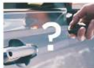
※画像はイメージとなります。

お客様の代わりに愛車を24時間 見守ります。ロック状態等が分かる 「リモート確認」、さらに万が一の 置閉め忘れでも「リモート操作」で 二度に安心です。