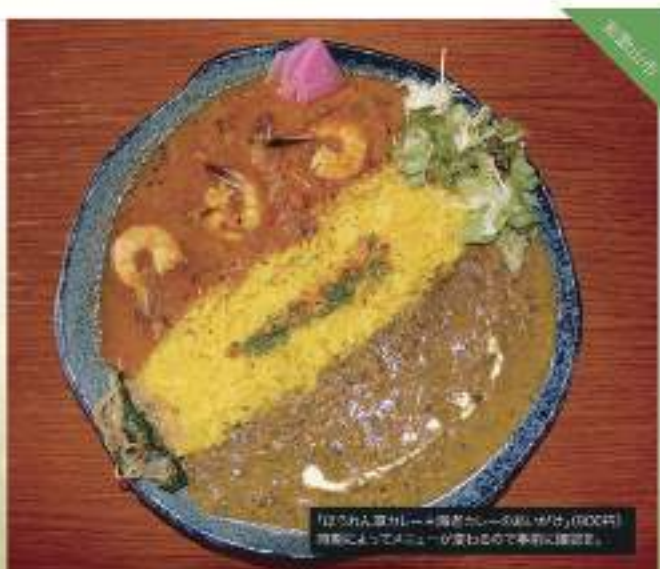
「ほうれん草カレー」(900円) 種類によってメニューが異なるので事前に確認ください。

☎ 073-499-4810 住所/和歌山県和歌山市 営業時間/11:00~19:00 休/水曜/日曜(お盆・年末年始) 駐車場/あり