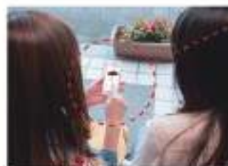
※画像はイメージとなります。

エンジンオイル、ブレーキオイルの 状態やToyota Safety Sense のセンサーなど、日々のマイカー の健康状態をいつでもチェック。 万一ウォーニングが立った時は、 対応方法をアドバイスします。