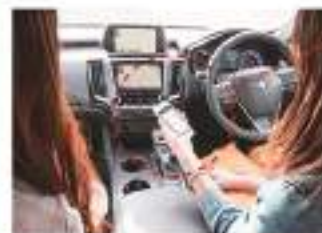
※画像はイメージとなります。

万一の故障や事故など、 トラブル時の緊急電話やFAQなど、 「困った時ほど」役に立つ情報に すぐにアクセス。