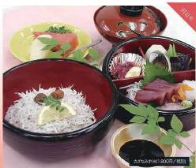
さざなみ弁当(1,200円/税別)

☎ 0739-22-3960 住所/和歌山県和歌山市 営業時間/11:00~14:00/14:30~21:00 (30:30) 休/水曜/日曜(お盆・年末年始) 駐車場/あり