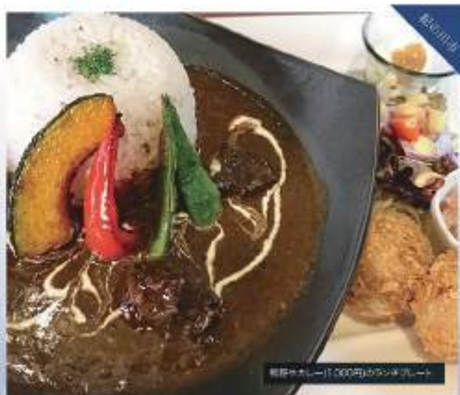
料理中カレー(1,000円)のランチプレート

☎ 0736-60-8233 住所/和歌山県和歌山市 営業時間/11:00~19:00(ランチは14:00まで) 休/水曜/月曜(お盆・年末年始) 駐車場/あり