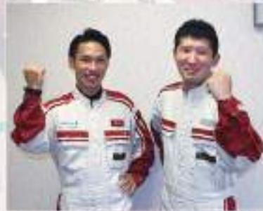
「仕事ではお客様、レースの時はドライバーに安心して乗っていただくという根本は変わりません」

「ランボルギーニ・スーパートロフェオ」は、世界最速のランボルギーニのクラスを使用、「世界最速のワンメイクレース」と称されています。2018年のアジアシリーズは4月～11月にアジア各国で6ラウンド・12レースを展開。6/30～7/1には鈴鹿サーキットで第3戦、7/21～22には富士スピードウェイで第4戦が開催されました。和歌山トヨタの2人は第3戦から参加しています。