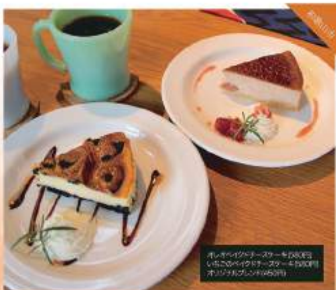
オレンジクッキーケーキ(900円) いちごのペイクドチーズケーキ(900円) オリーブクッキー(450円)

☎ 073-455-4030 住所/和歌山県和歌山市 営業時間/10:30~17:00(土曜は10:00~17:00) 休/水曜/日曜(お盆・年末年始) 駐車場/あり