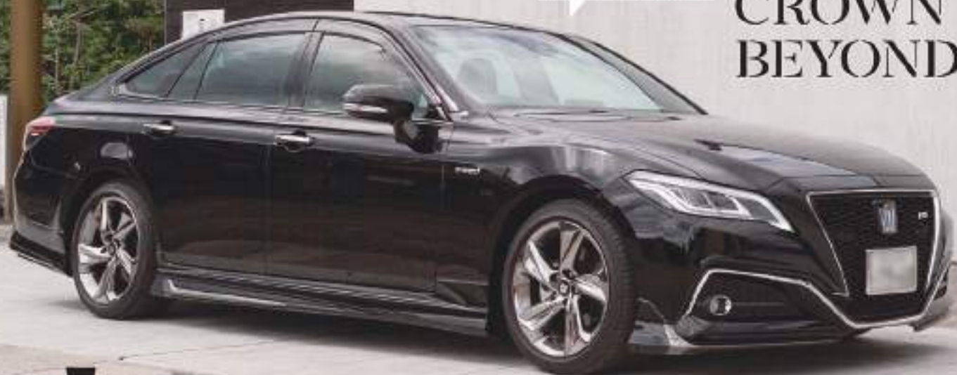
※色味は写真と異なる場合があります。