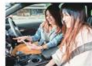
※画像はイメージとなります。

お客様の運転傾向をもとに、 「安全な運転」「エコな運転」の 2つの観点で自動診断し、 週に1回、検点とアドバイスを 配信します。