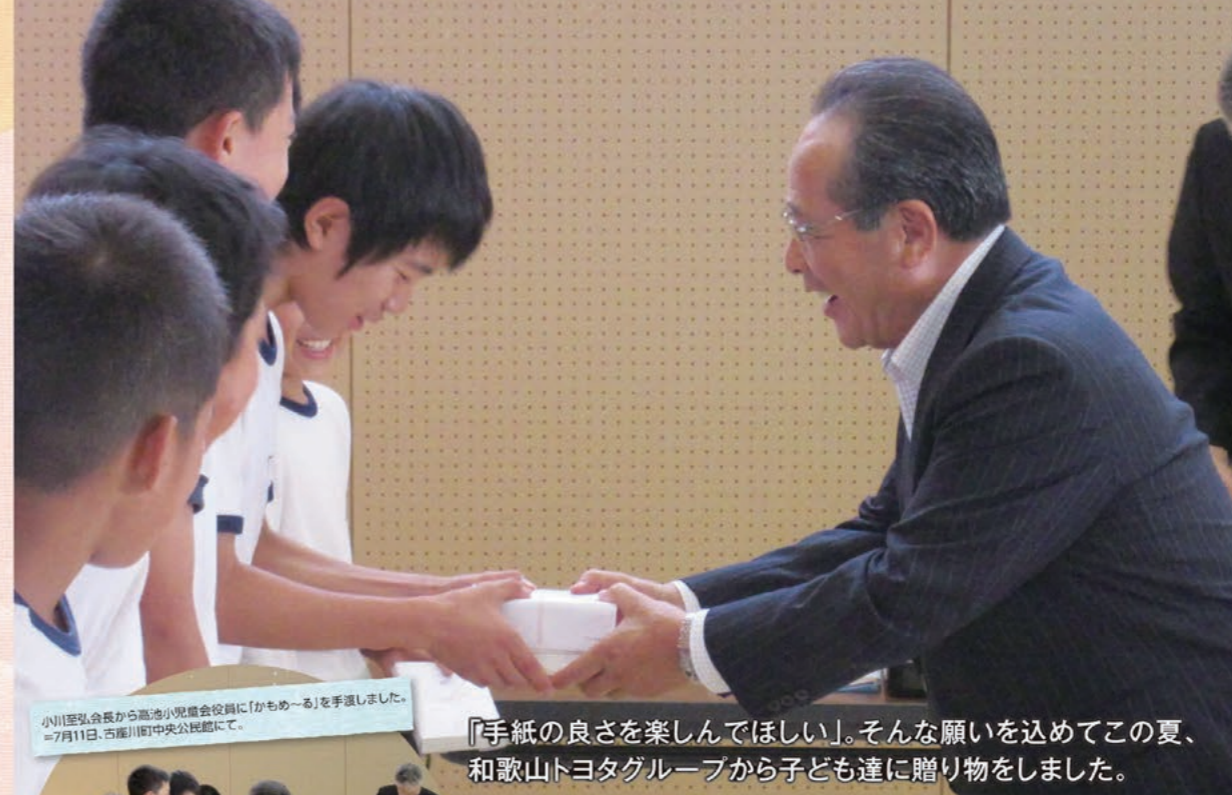
「手紙の良さを楽しんでほしい」。そんな願いを込めてこの夏、和歌山トヨタグループから子ども達に贈り物をしました。