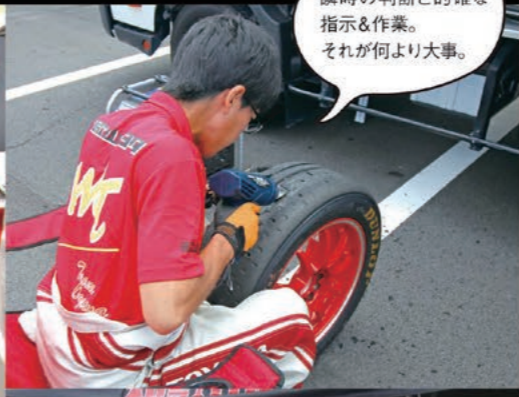
瞬時の判断と的確な指示&作業。それが何より大事。