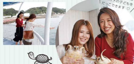
12:30~14:30はウミガメの子どもをだっこできます!