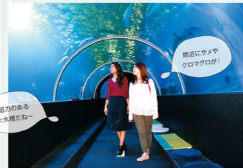
迫力のある大水槽だね~