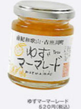
トーストにもヨーグルトにも合う朝食必須アイテム!