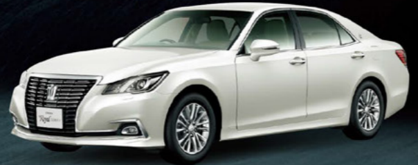
CROWN "Royal" SERIES

■クラウンロイヤルシリーズ車両本体価格帯 3,730,000円[ 2.5 ロイヤル 2WD ]~5,906,000円[ 2.5 Hybrid ロイヤルサルーンG Four 4WD ]