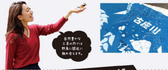
自然豊かな工房の外では野鳥に顔近に顔合わせます。

〒東牟婁郡古座川町小川645 ☎0735-79-0194 金曜日 予約受付時間/9:00~18:00