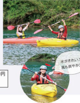
水がきれい! 風も爽やか!