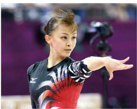
現役時代ロンドン五輪(2012)にての競技風景