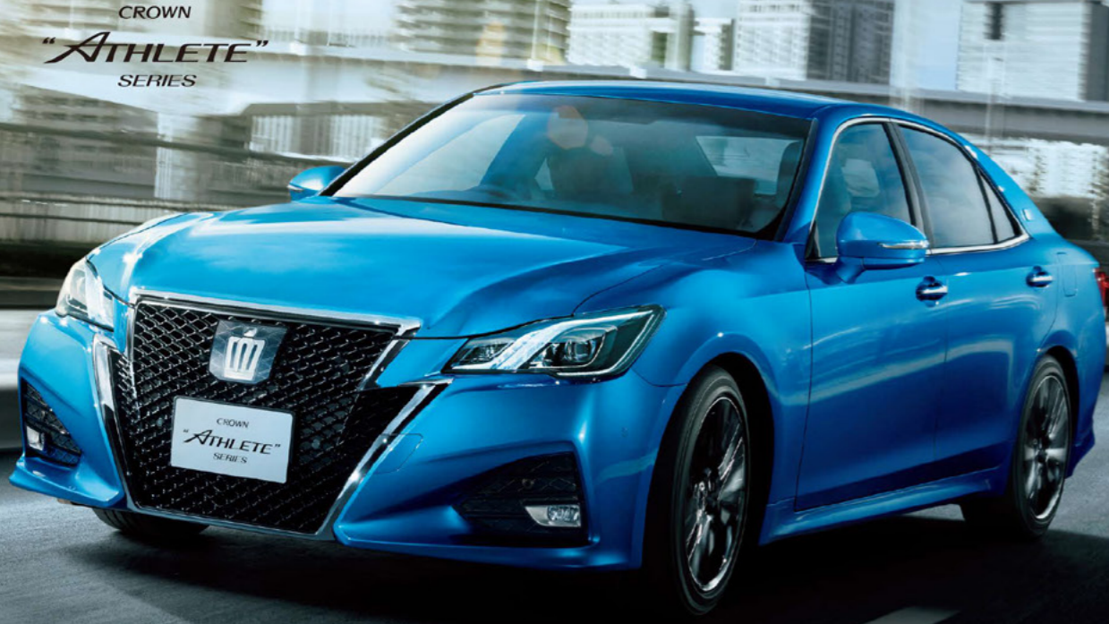
CROWN "ATHLETE" SERIES

■クラウンアスリートシリーズ価格帯 3,880,000円[ 2.0 アスリートT 2WD ]~6,100,000円[ 3.5 アスリートG 2WD ]