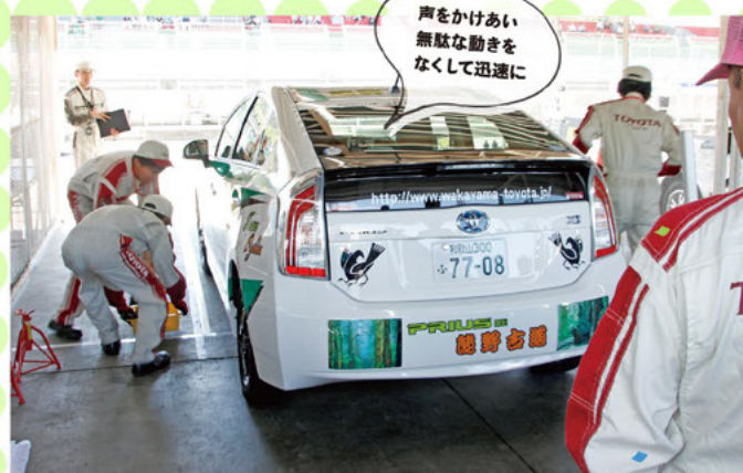
声をかけあい 無駄な動きを なくして迅速に

いよいよ練習の成果を発揮する日、グリッドに入る前にメンバー全員で円陣を組み、気合を入れます。心をひとつに、技を出し切って。狙うは全国大会の切符!