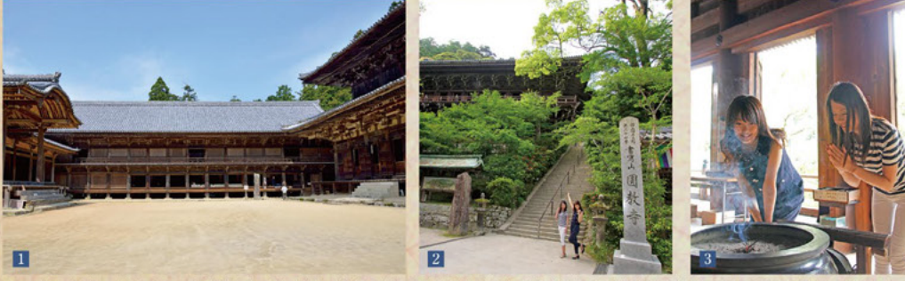
①コの字型に並ぶ3つの堂は、向かって左から常行堂・食堂・大講堂。お経の講義や論議が行われる学問と修行の場。常行堂は、阿弥陀仏の名を唱えながら本尊を回る修行の場。食堂(じきどう)は本堂、修行僧の寝食用の建物であり、現在は写経道場として使用。この広い空間を活かして、様々な映画やドラマの撮影も行われています。②石段を上って、西国三十三番の27番目の札所・摩崖尼、清水寺と同じ壮大な舞台空間の境内には、如意輪観音がまつられています。

訪ねてみよう! 黒田官兵衛のゆかりの地 「西の比叡山」 書寫山圓教寺 比叡山・大山と並ぶ天宮3大霊場の一つで、18haもの境内に荘厳な伽藍が点在しています。秀吉が播磨攻めの際、別所・毛利氏から狭み撃たれる窮地に陥り、官兵衛の進言でこの書寫山圓教寺に本陣を移し、別所氏が籠城する三木城攻めに指揮しました。 ① 姫路市書寫2968 ② 079-266-3327 入山料(志納金)一人500円 ロープウェイ往復900円 ロープウェイ山上駅から摩崖まで有料マイクروبス(500円)あり