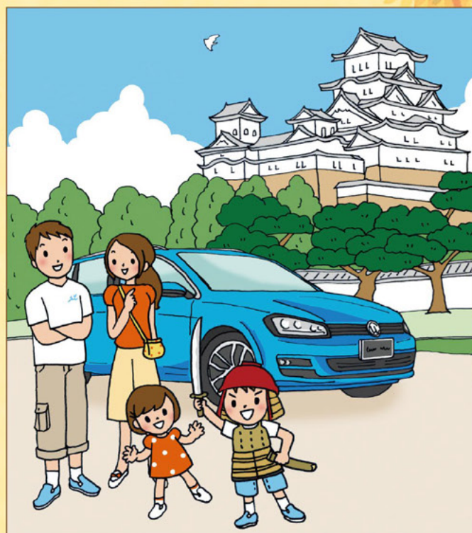
Illustration: マツカワ チカコ