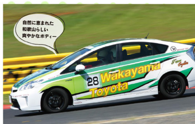
自然に恵まれた 和歌山らしい 爽やかなボディ

ピット作業は、エンジニアにとって大きな腕の見せどころ。ここもポイント&ペナルティの対象になるので、緊張しながらも手早くかつ丁寧に、作業に取り組みます。