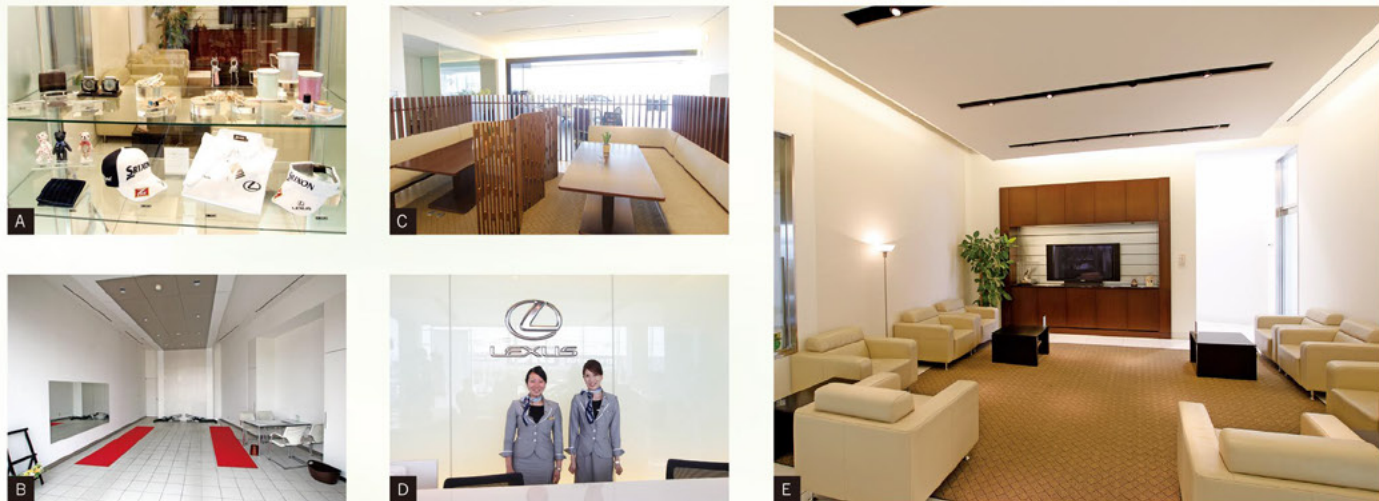
A レプリカシャツやキャップなどの松山英樹選手コレクションを始め、レクサスのこだわりやグレード感をより身近に感じられるアイテムが揃います。B 雨の日でも美しい状態のままで車をお披露目できる屋内型の納車ルームには、空調設備や排気ダクトを完備しました。車を輝かせる明るいライティングや心地よいBGMで、オーナー様が最も心躍る「納車の瞬間」を華やかに演出します。C ご家族で気兼ねなく寛いでいただけるファミーラウンジ。小さなお子様を寝かせる長椅子や、ゆったりとした大きなテーブルをご用意しております。D 来店された方へ、最初にお迎えするレセプションスタッフ。常に笑顔と感謝の心を忘れません。どんなささやかなことでも、お気軽にお申し付けください。E ゆっくりとお過ごしいただけるオーナー様専用のラウンジ。点検や整備の間の待ち時間にも、レクサスならではのラグジュアリー感をご堪能いただけます。