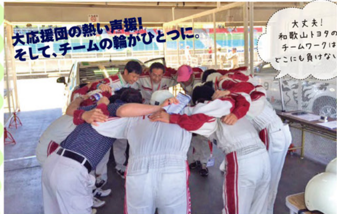
大応援団の熱い声援! をして、チームの輪がひとつに。

42チームを2つのグループに分けて競技が行われました。和歌山トヨタはBグループの9番グリッド。他チームの戦略やペースに感わされないよう、レースに臨みます。