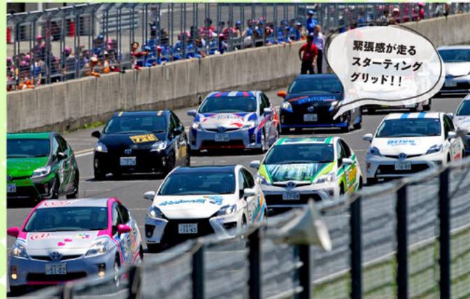
緊張感が走る スターティング グリッド!!

42チームを2つのグループに分けて競技が行われました。和歌山トヨタはBグループの9番グリッド。他チームの戦略やペースに感わされないよう、レースに臨みます。