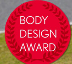
※ボディデザインの賞を受賞しました。