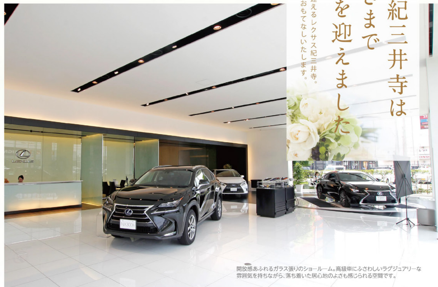
開放感あふれるガラス張りのショールーム。高級車にふさわしいラグジュアリーな雰囲気を持ちながら、落ち着いた居心地のよさも感じられる空間です。

は化粧室のアメニティの充実や、冷え対策のひざ掛けサービスをお子様には個室タイプのキッズルームをご用意しており、ご家族でゆっくり過ごしていただける空間づくりにも配慮しております。こうしたサービスは、スタッフ同士のアイデアや情報交換からだけでなく、オーナー様の意見をもとに取り入れたものも。ささやかなご希望でも、お申し付けいただければその都度検討させていただきます。「画一的ではなく、お客様個々のご期待に沿った提案を」。スタッフ全員が同じ気持ちでおもてなしいたしますので、ぜひお気軽に「来店ください」。