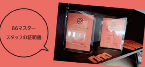
86マスター スタッフの証明書

「AREA 86」とは、「トヨタ86」の展示車・試乗車を設置し、かつ86に精通したマスタースタッフが常駐する店舗。オリジナルグッズやアクセサリの取り扱いはもちろん、スポーツカーファンが集ってコミュニケーションを楽しむ“大人のたまり場”としての役割も担っています。