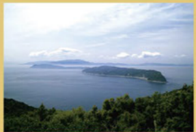
友ヶ島は、加太沖にある無人島群。瀬戸内国立公園の紀淡海峡に浮かぶ、沖ノ島・地ノ島・虎島・神島の4島の総称です。加太港から沖ノ島の野奈浦棧橋までは、「友ヶ島汽船」で約20分。