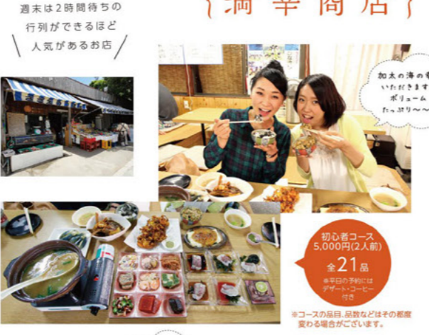
週末は2時間待ちの行列ができるほど人気があるお店