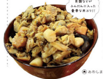
貝類なせがふんだんに入った豪華な丼ぶり!!

初心者コース 5,000円(2人前) 全21品 ※平日の予約にはデザートメニューも付く ※コースの追加、変更などはその都度要する場合がございます。