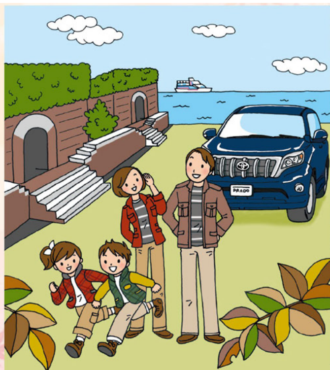
Illustration: マツカワ チカコ