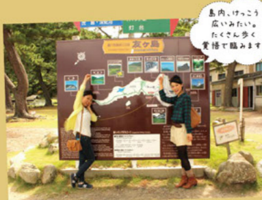
島内、けっこう広いみたい。たくさん歩く覚悟で臨みます!