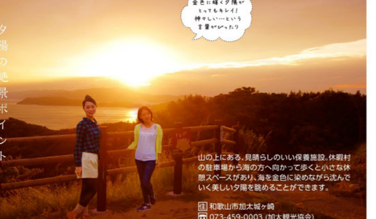
金色に輝く夕陽がとってもキレイ! 神々しい...という言葉がぴったり

山の上にある、見晴らしのいい保養施設。休暇村の駐車場から海の方へ向かって歩くと小さな休憩スペースがあり、海を金色に染めながら沈んでいく美しい夕陽を眺めることができます。