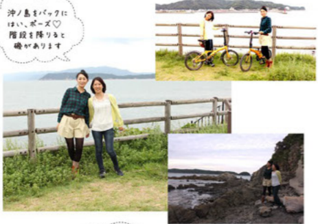
沖ノ島をバックには、ボーズ階段を降りると磯があります

友ヶ島や加太港を一望する城ヶ崎の先端部にある公園。引き潮時に海岸へ降りると、洗濯板のようにギザギザとした地形が見られます。潮だまりの生物観察や磯釣りのスポットとしても人気。