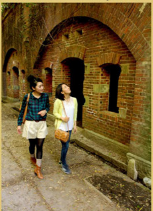
赤レンガの建物が解体され、大きなコンクリートの塊がそのまま残る不思議な風情の砲台跡。内部への立ち入りはできません。