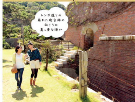
レンガ造りの崩れた砲台跡の向こうには、真・黄金の海が